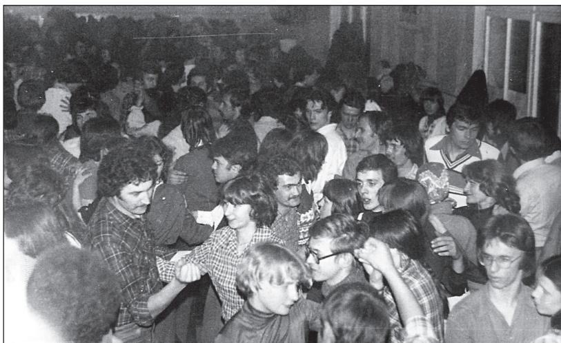
Esti táncház a székelyudvarhelyi Táncháztalálkozó

táncházak elméleti és szakmai kérdéseit, amelyeknek nyílt megvitatására is sor került az éveken át megrendezett táncháztalálkozókhoz kapcsolódó tudományos konferenciákon. Az erdélyi táncházak népszerűsége egyúttal a tánczenekarok népszerűségét is jelentette, ezt kihasználva a kolozsvári és marosvásárhelyi közszolgálati rádiók több stúdiófelvételt is készítettek, majd az 1980-as években az Electrecord Hanglemezgyár több tánczázlemezt jelentetett meg.