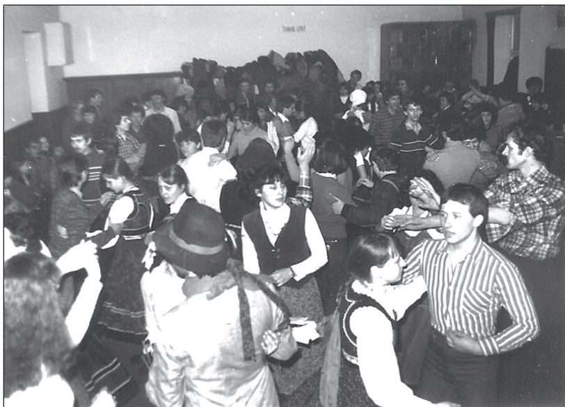
Farsangi táncház a kolozsvári Monostori úton