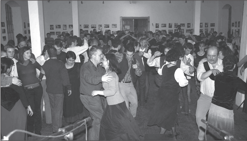
Évfordulós ünnepi táncház a kolozsvári Tranzit Házban, 2007. február 17-én

zálódó folklorizmus, azaz a két folyamat egymást nemcsak kiegészíti, hanem állandóan változtatja is.