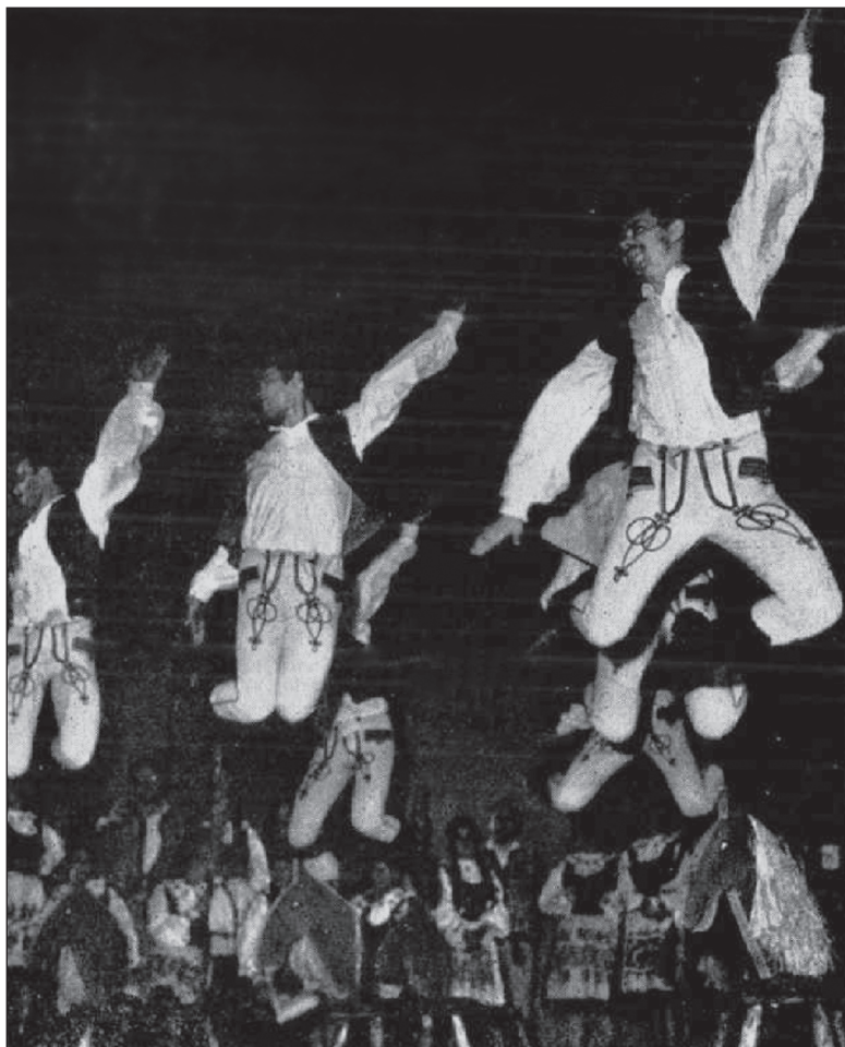
Korabeli sajtófotón a Maros Művészegyüttes (Igaz Szó, 1982/8.)

lusban és színpadi koreografáltságban egyaránt. „A népi együttesünk pusztá szereplésével fontos szerepet és feladatot vállalt máris a vidéki művelődési otthonok színvonalemelésére, falusi karvezetők, vidéki táncsoportok tanítóinak kiképzésére, tehát nemcsak tiszta népi művészetet mutat be, hanem a zene jövődő mestereit is a népzene