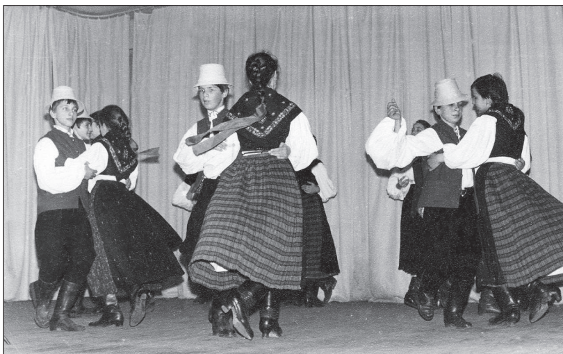
Széki táncok a kolozsvári Brassai Sámuel Líceum Folklórkörének előadásában