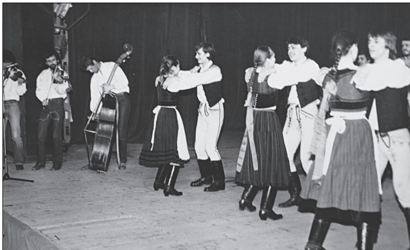
A kolozsvári Kodály Néptáncgyűttes fellépése, 1982. március 28-án

a megújuló romániai magyar néptáncmozgalom első egész estés előadásának tekinthető. Erről az egyik fellépő így nyilatkozott: „az Ifjúságom gyöngykoszorú újszerű előadás volt. Színpadainkon stilizált és nem egyszer durván meghamisított néptáncot láthatunk, a hagyományörző együttesek néhány szép, színvonalas szereplésének kivételével. Ezért újszerű együttesünk célkitűzése, eredeti néptáncaink és népzeneink stílushű színpadi tolmácsolása. Munkánkat abban a meggyőződésben végezzük, hogy a néptánc és népzene a színpadon sem veszítette el létjogosultságát.” 172